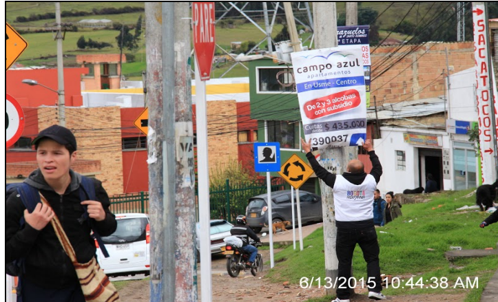
FOTO 1. Elementos instalados en Espacio Público Ubicados en la Localidad de Usme. Operativo del 13-06-2015.

Registro fotográfico, Operativo de Control efectuado el día 13/06/2015